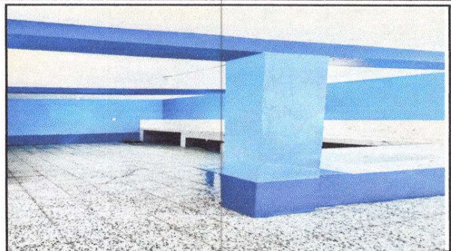
Foto 8: Finalización de colocación de piso de granito de interior de cocina escolar.