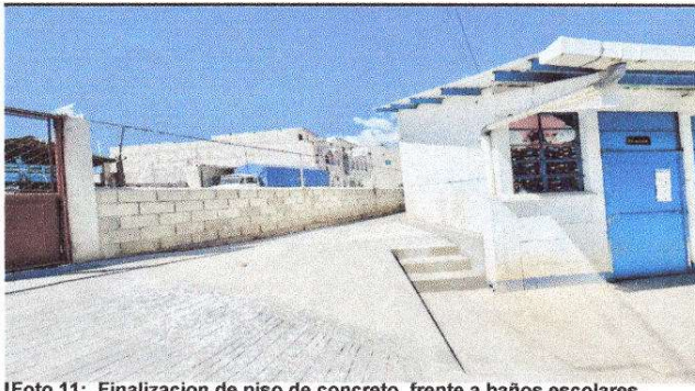
Foto 11: Finalización de piso de concreto frente a baños escolares.